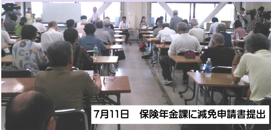
7月11日 保険年金課に減免申請書提出