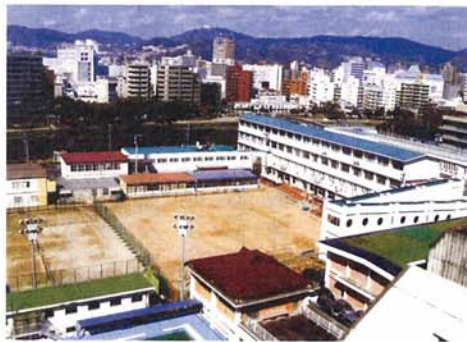
中区大手町の特別支援学校

財政難で「土地は買えない」と、市の都合で用地を決めず、市民の意見を聞きながら、ともに作り上げる姿勢が必要です。