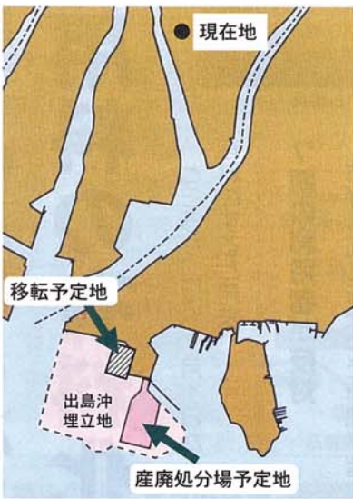
市が候補地にあげている出島沖埋立地