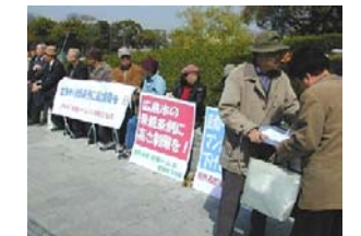
守る会の座り込み=4月8日

3月31日 秋葉市長が三井不動産広島支店に高さを再考するよう要請文を送付(現時点で同社からの回答なし)