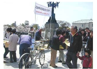
守る会の元安橋宣伝=4月6日

同支店は04年11月頃の非公式協議から05年5月に建築確認が下りるまでの間、市から高さの話はなかったとし、建設中のマンションの「全戸完売」のため計画変更は困難と回答