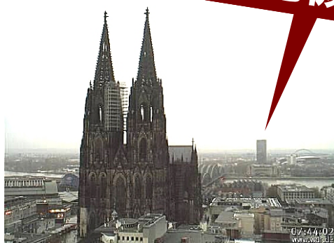
大聖堂の右後方に見える問題の高層ビル

このまま政府が解決策を示さなければ、世界遺産の登録抹消の手続きがなされるとのことです。