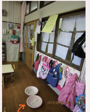
雨漏りを受ける洗面器

安上がりに耐震化対策を進めるため、子どもの安全と引き換えに民間移管を保護者に迫るようなやり方は、決してとるべきではありません。すべての保育園の耐震化に、市が責任を持つのは当然です。