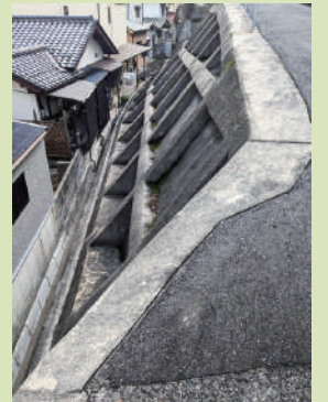
対策された急傾斜地

23年度の決算額を見ると住宅の防災・減災推進事業は予算の半分しか実施されていません。住民に周知徹底することや補助額を引き上げることを求めました。