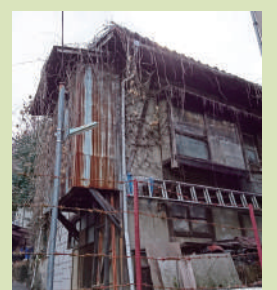
危険な老朽空き家

台風や地震で危険空き家に異変が生じた場合、行政が現場に駆け付け危険度判定などの対応を素早く行う窓口と体制づくりも提案しました。