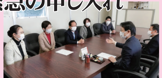
2020年12月15日 市への申し入れ