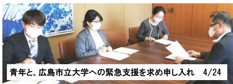
青年と、広島市立大学への緊急支援を求め申し入れ 4/24