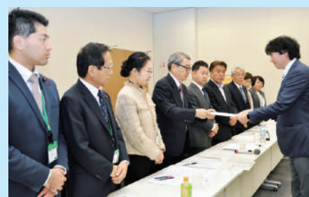
国に防災対策の推進を要望

市は「防災事業は大規模プロジェクトなどとバランスを取りながら進めている。今後も、豪雨災害の復旧・復興を