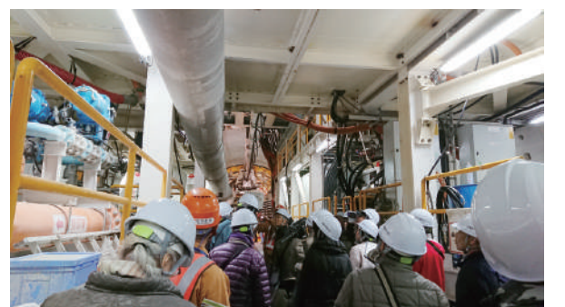
トンネル工事の現場を視察(2019年12月16日)

です。その一方で、高齢者交通費補助を廃止し、遅れている子ども医療費の拡充も足踏み状態です。市民生活や教育の予算は出し惜しみ、西日本豪雨災害被災者を支援する国保料や介護保険料の一部負担の減免などを打ち切っています。