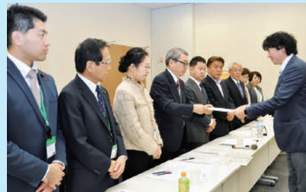
国に防災対策の推進を要望

はじめ、公共施設の耐震化、河川改修、法面等崩壊防止対策などに積極的に取り組んでいく」と答弁しましたが、独自に防災事業を行うことには極めて消極的でした。